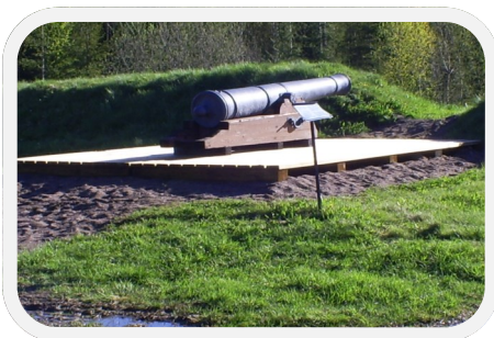
Livet på Eda Skans.