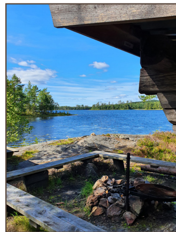
Vindskydd vid Ämten, 300 m vid sidan om leden.