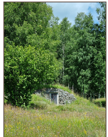
Jordkällare vid Lafallhöjden.