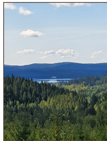
Utsikt mot Treen från Lövhöjden.